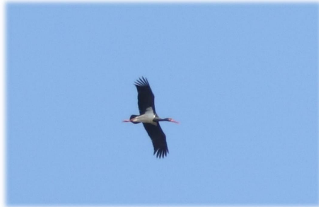
Figure 39 : Cigogne noire au-dessus de l'AEI (NCA, 2019)

Observations : Un individu a été observé, le 30 mars 2019, en vol au nord-est de la zone d'étude.