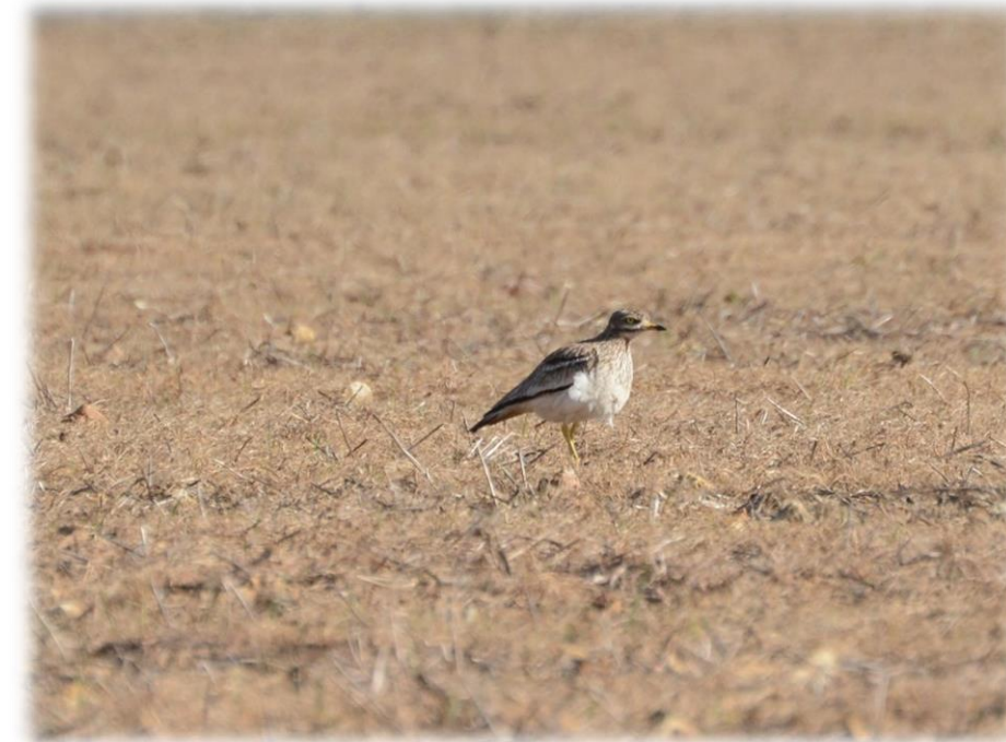
Figure 38 : Œdicnème criard (Mars, 2019)

Observations : L'Œdicnème criard a été contacté sur le site dès le 20 mars 2019 et le passage suivant sur l'aire d'étude. Son installation sur les sites de reproduction débute dès le mois d'avril (source : INPN) à son arrivée de migration. Ces individus sont donc considérés comme potentiels nicheurs sur le site.