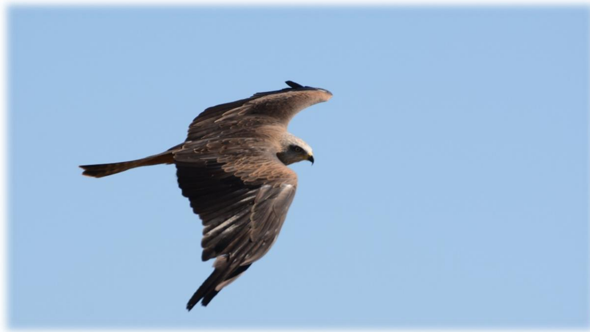
Figure 37 : Milan noir (NCA, 2018)

Observations : Un total de onze individus ont été observés au cours de cette période. Parmi les 8 individus observés le 3 avril 2019, deux individus étaient en parade avec l'apport de matériaux à l'ouest de l'AEI. Ces comportements laissent supposer la construction d'un nid et la future nidification de l'espèce sur l'aire d'étude.